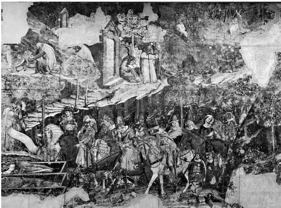
Рис. 1. Б. Буффальмакко. «Триумф смерти»

мал транскрипцию как гравюру 4 . Гравюра же в завершённом виде представляет собой печатный оттиск с «литеры» [4, с. 274] (металлической печатной формы) на различных поверхностях (металле, линолеуме, картоне, воске и т. д.).