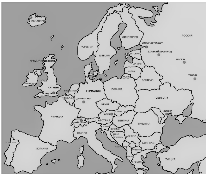
Рис. 1. Расположение домов-музеев и обществ имени С.В. Рахманинова

Каждое из обществ имеет свое ведущее направление, которое обусловлено его составом, местонахождением, уровнем ресурсного обеспечения и рядом других причин. Деятельность каждого рахманиновского общества будет освещена отдельно с целью выявления основных